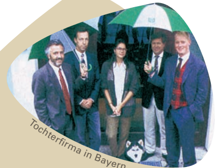
Tochterfirma in Bayern

Die Firma Myslik expandiert nach Bayern und gründet ein Tochterunternehmen.